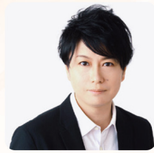
ブッチーニおじさん

東京藝術大学大学院修了。新国立劇場オペラ研修所修了。文化庁新進芸術家留学制度1年派遣生として留学。第3回マダム・バタフライ国際コンクールin長崎第2位。